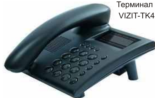
Терминал консьержа VIZIT-TK401DM

При отрицательном ответе хозяина охрана отказывает посетителю.