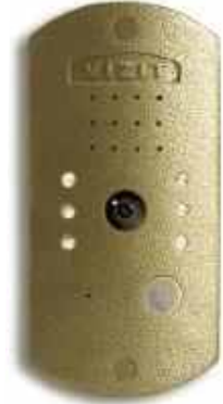
Вызывная панель с камерой