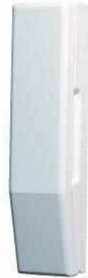
Аудиотрубка охраны с кнопкой открытия

На каждой калитке снаружи установлена вызывная панель со встроенной видеокамерой и кнопкой вызова охраны. Также на калитке установлен электрозамок.